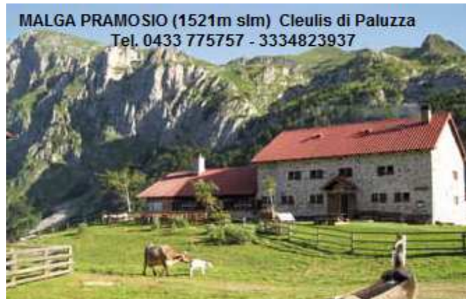
MALGA PRAMOSIO (1521m slm) Cleulis di Paluzza Tel. 0433 775757 - 3334823937